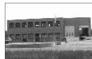
La sede di Villafranca

ora dato in comodato d'uso gratuito alla Croce Verde. L'entusiasmo per i festeggiamenti mescolato alla volontà che tutto procedesse nel migliore dei modi ha reso il pomeriggio piacevole e speciale grazie anche al grande aiuto che hanno fornito i volontari della Protezione Civile e gli amici Alpini. Questi ultimi hanno da sempre dimostrato un vero affetto ed un grande attaccamento alla realtà villafranchese della Croce Verde. Presenti tutte le autorità della realtà comunale, provinciale e regionale che in un modo o nell'altro hanno saputo abbracciare la causa del Polo Emergency.