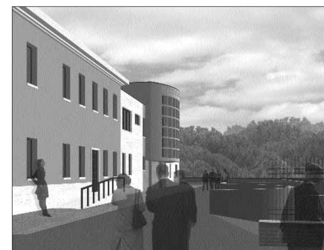
Come sarà la nuova sede una volta ultimati i lavori