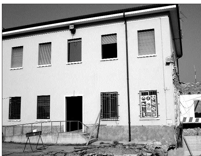
Sopra e in alto nella pagina a fianco: il cantiere della nuova sede