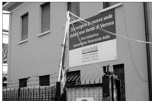
Il cantiere per la costruzione della nuova sede. In alto: come sarà a lavori ultimati