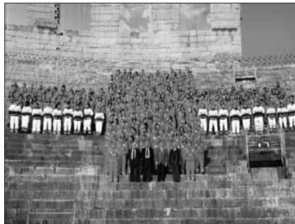
I croceverdini fanno memoria del Centenario posando nell'anfiteatro areniano

Tale è il significato della manifestazione che la città tutta ha vissuto sabato 28 novembre, la quale ha profuso a larghe mani commozione profonda a quanti hanno accolto in Piazza Bra le varie rappresentanze dei volontari croceverdini e sono stati poi presenti nell'auditorium della Gran Guardia per seguire il programma ufficiale dei festeggiamenti. Non finalizzati ad una mera celebrazione, quanto invece voluti per dire ad alta voce del valore fondante del volontariato per una società civile. Di questi valori è nobile testimonianza appunto Croce