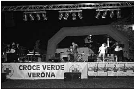
Nelle foto momenti della variegata giornata di Croce Verde al Parco S. Giacomo