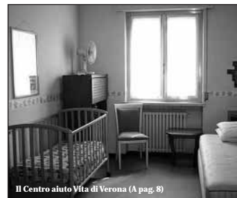
Il Centro aiuto Vita di Verona (A pag. 8)

«La Croce Verde, vero patrimonio morale e testimonianza dell'anima nobile della gente veronese»